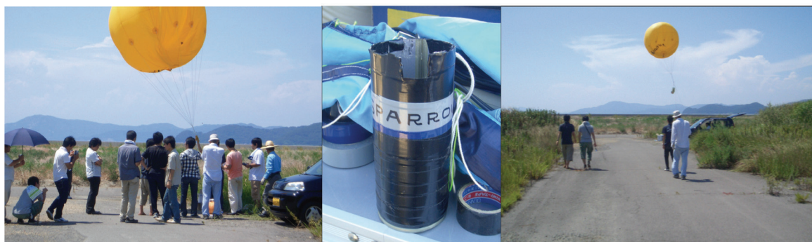
図 1. 香川 CanSat

我々のプロジェクトでは、結果として今年度に CanSat イベント 1 回、宇宙体験教室 1 回行った。CanSat イベントとしては、香川県坂出市番の州で CanSat のイベントを実施した。CanSat とは、350ml 缶に衛星機器を詰め込んだ超小型衛星のことであり、人工衛星の主要機能を担う OBC、通信機や各ミッション機器を搭載し、アマチュアロケットや気球によって打ち上げられる。そしてロケットや気球からの放出後、パラシュートによって降下してくる間に各種ミッ