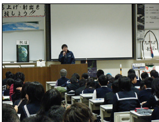
図 3. 打上げ中継イベント

このプロジェクト事業を実施したことにより、地域の方々には大学の活動を知ってもらい、身近に感じてもらうための良い窓口となる。香川大学自体の紹介としても随分と効果があると思う。地域の子供たちをはじめとして、より地元から宇宙を感じるができる機会を作り、広く地域的な活動とすることで、宇宙への興味を持ってもらえたと思う、地域の方々との交流から四国初・香川発のこのプロジェクトを盛り上げていくことで、学生の意識向上にもつながると考えられる。参加