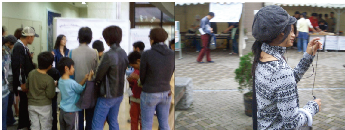
図 2. ミニ ARDF イベント

ョンを行うというものである。このイベントは、地域の方々へ参加の呼びかけを行い、共同開発を実施した。これと共に、香川大学と同様に CanSat の開発に取り組んでいる近隣大学にも参加を呼びかけ、地域との交流だけでなく大学間交流も行った。しかし、今回のこのイベントは告知が遅かったために参加者が少なかった。また、ミニ ARDF（電波探索競技の簡易版）イベントを開催し、小学生や地域の方々に参加していただいた。衛星を探すように無線機から出る電波を探すということを体験してもらい知っていただける機会を作れた。また、香川大学衛星 KUKAI の打上げ後、ホームページを用いて情報公開を行ったり、全国のアマチュア無線家の方の協力を得て衛星通信を行っている。